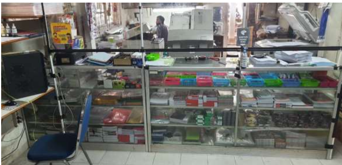
Gambar 3 Bisnis Foto Copy Milik KWP