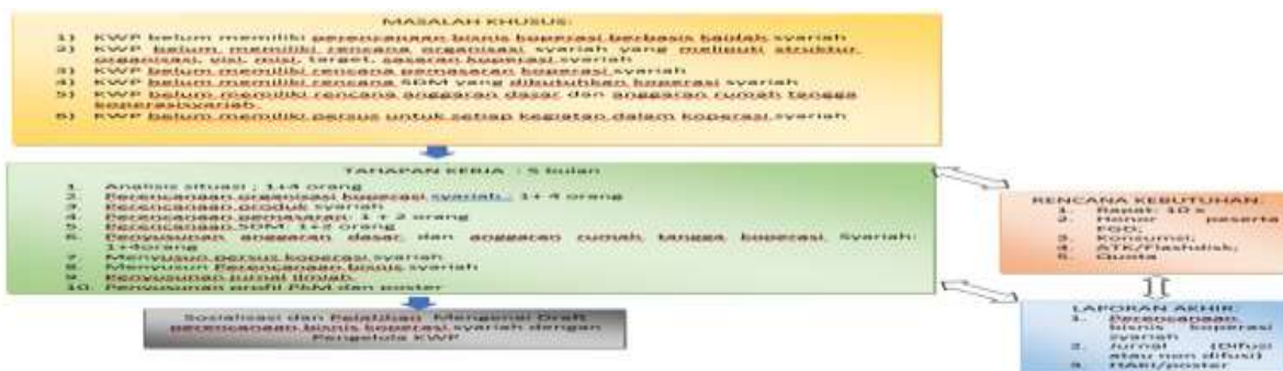
Gambar 7. Rencana Kerja Tim PKM

Pelaksanaan kegiatan PKM: (1) Recek permasalahan spesifik sebagai materi diskusi internal tim; (2) Anggota tim berbagai tugas menyusun draft "Rencana Bisnis"; AD; ART/Pola kebijakan; Persus, semuanya berbasis syariah; (3) Draft I Rencana bisnis, AD, ART?Pola kebijakan, dan Persus yang berbasis Syariah dibawa ke dalam FGD 1 antara tim PKM dengan staf ahli dan praktisi koperasi Syariah; (4) Tim melakukan revisi drfat 1 berdasarkan hasil FGD I; (5) Draft 2 yaitu hasil revisi draft 1 dibawa ke dalam FGD II antara Tim, staf ahli, pengurus, pengawas dan manajer; (6) Finalisasi hasil; (7) Sosialisasi hasil. Gambar mengenai rencana kerja kegiatan PKM lengkap dengan tugas setiap anggota tim dapat dilihat pada Gambar 7.