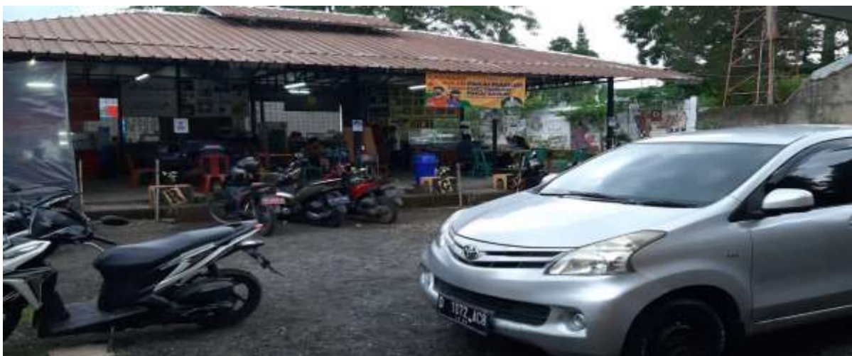
Gambar 4 Aktivitas Bisnis untuk pemanfaatan Lahan Milik KWP