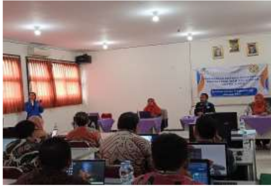
Gambar 2. Pelaksanaan PKM