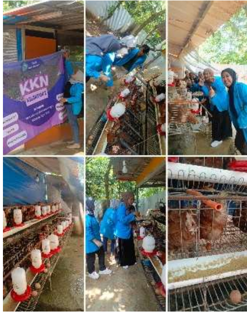
Gambar 2. Pendampingan Peternakan Ayam

Keberhasilan implementasi ini didukung oleh beberapa faktor, antara lain: (1) metode pelatihan yang praktis dengan contoh data nyata dari usaha pemilik, sehingga lebih mudah dipahami; (2) keterlibatan aktif pemilik selama sesi pelatihan, yang tidak hanya mengamati tetapi langsung mencoba menginput data pada sistem Accurate. Semua ini membuat hasil implementasi tidak hanya sebatas penyusunan laporan tetapi juga meningkatkan kemampuan berpikir analitis pemilik dalam membaca hasil laporan keuangan mereka sendiri.