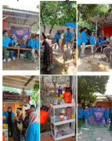
Gambar 1. pembuatan laporan keuangan Sistem Accurate

Pelaksanaan pendampingan pembuatan laporan keuangan menggunakan Sistem Accurate oleh Tim STEBIS Bina Mandiri menunjukkan hasil positif, baik dari sisi keberhasilan teknis maupun minat pemilik peternakan. Hasil dari pendampingan ini adalah tersusunnya laporan keuangan yang lebih modern, mudah dipahami, dan mampu menunjukkan laba riil dari usaha. Pemilik usaha juga mulai menyadari pentingnya pencatatan yang rapi dan tertarik untuk melanjutkan pembelajaran lebih lanjut. Program ini berpotensi berkelanjutan untuk UMKM lain yang ingin mengetahui cara membuat laporan keuangan berbasis Accurate.