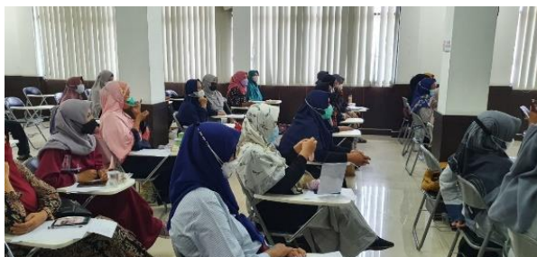
Gambar 3. Peserta UMKM Jabar Juara Kota Depok sedang memperhatikan penjelasan tim PKM Universitas Pamulang

Pada sisi finansial sebagian besar permasalahan yang harus dihadapi UMKM untuk mempertahankan dan mengembangkan usahanya seperti permasalahan permodalan, kurangnya pengetahuan dan kurang sadarnya pemilik UMKM pada aspek penting seperti pengelolaan keuangan, dan penggunaan teknologi.