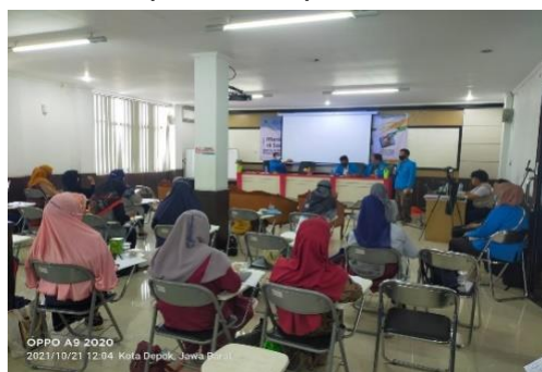
Gambar 1. Tim Pengabdian Kepada Masyarakat Universitas Pamulang memberikan materi pelatihan dan sosialisasi kepada peserta UMKM Jabar Juara Kota Depok

UMKM merupakan salah satu subsektor penggerak ekonomi daerah dan menjadi sektor penyangga ekonomi nasional serta sebagai sektor utama pengembangan ekonomi negara. Adapun berdasarkan data tahun 2018 dari Kementerian Koperasi dan Usaha Kecil dan Menengah, Indonesia mempunyai 64,19 juta usaha ataupun dipersentasekan sebesar 99,99 % daripada keseluruhan unit usaha yang ada di Indonesia. Dari total 64,19 juta usaha di Indonesia ini, sebanyak 63,35 juta atau 98,68% dikategorikan usaha mikro, kemudian sebanyak 783.132