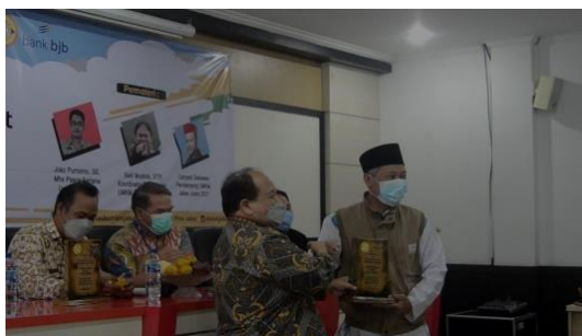
Gambar 4. Serah terima plakat dari Pendamping UMKM Jabar Juara Kota Depok kepada Kaprodi Pascasarjana Universitas Pamulang

Wilayah Depok sebagaimana dengan wilayah di Indonesia lain mempunyai jumlah unit UMKM yang besar dan sudah berdiri sejak lama. Beberapa masalah yang ditemukan dalam pemahaman dan upaya yang perlu dilakukan dalam meningkatkan usaha mereka khususnya UMKM, yang menyebabkan kurang berkembangnya usaha mikro dan kecil di wilayah Depok antara lain minimnya pemahaman pelaku UMKM tentang Pengelolaan Keuangan dan Penggunaan Fintech . Pelaku UMKM pada umumnya hanya melakukan pencatatan sederhana berupa pemasukan dan pengeluaran. Bahkan ada yang tidak mencatat sewa tempat sebagai beban usaha, sehingga usaha terlihat menghasilkan laba yang besar karena beban tidak dicatat sebagaimana mestinya. Akibatnya adalah pencatatan tidak menggambarkan kondisi keuangan usaha yang sesungguhnya. Pengelolaan keuangan yang tidak tepat juga mengakibatkan penetapan harga pokok penjualan yang ditetapkan tidak tepat. Dampaknya adalah perusahaan akan mengalami kerugian dan mengakibatkan kebangkrutan. Selain itu, dengan memanfaatkan Fintech pelaku UMKM dapat bertransaksi keuangan lebih mudah seperti metode pembayaran jual beli produk yang sudah digital, penyimpanan dana secara digital menjadi praktis dan cepat, dan juga memudahkan pelaku UMKM dalam mencari pendanaan/modal usaha. Oleh karena itu pengelolaan keuangan menggunakan akuntansi digital dan memanfaatkan Fintech adalah hal yang sangat diperlukan sebagai solusi masalah manajemen keuangan usaha.